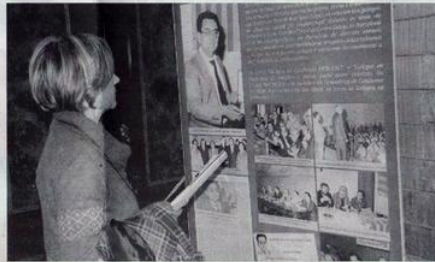
■ Unha asistente ao acto anté un dos paneis da exposición.

Todos eles se referiron á figura do poeta e a súa obra, da que destacaron, entre outras cousas, que foi secretario do Centro Galego de Barcelona e "chegou a ser a ponte perfecta entre os galegos en Cataluña e a Galicia interior a través da súa poesía, da súa narrativa e das súas crónicas xornalísticas" que publicou, entre outros medios, en El Ideal Gallego, El Progreso e Faro de Vigo. Tamén que a forza expresiva da súa poesía é froito do amor do autor por Galicia e o galego e da súa experiencia como obreiro en Cataluña nas décadas dos cincuenta, se-